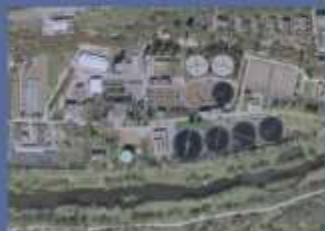
Kläranlage Pforzheim (250.000 E) Erweiterung um nachgeschaltete DN