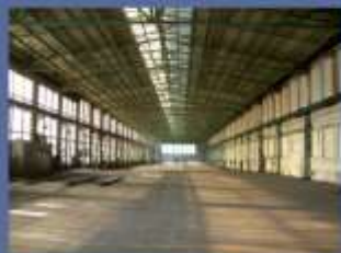
Ingenieurleistungen für den Rückbau des Luig-Areals in Illingen