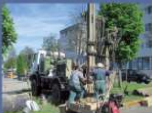
Geotechnische Erkundung bei der ARCUS-Klinik in Pforzheim