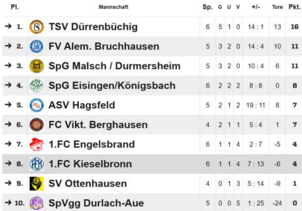
Tabelle Damen 2024/2025